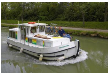
Pénichettes® 935 / 935W

Ab EUR 1398,00 (gültig für Deutschland & Polen) z.B. Samstag ab 14h bis Samstag 9h